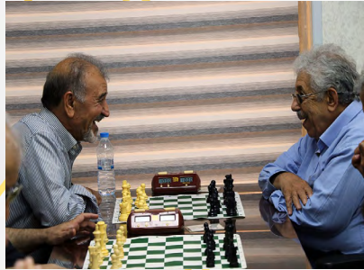
آنها سرمایه‌های ما هستند