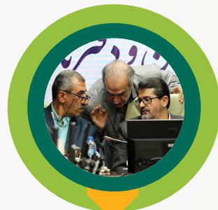
خندانی خواستار شد

روابط عمومی notary-news.ir notarynews.ir@gmail.com